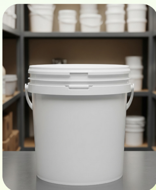
Bidons, seaux, ...